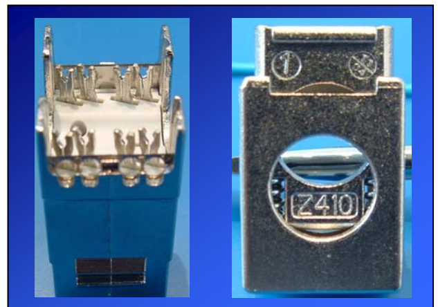
Корпус с контактами типа AWC и хвостовик с пружинным зажимом кабельного экрана