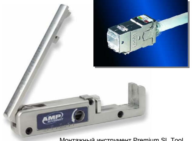
Монтажный инструмент Premium SL Tool